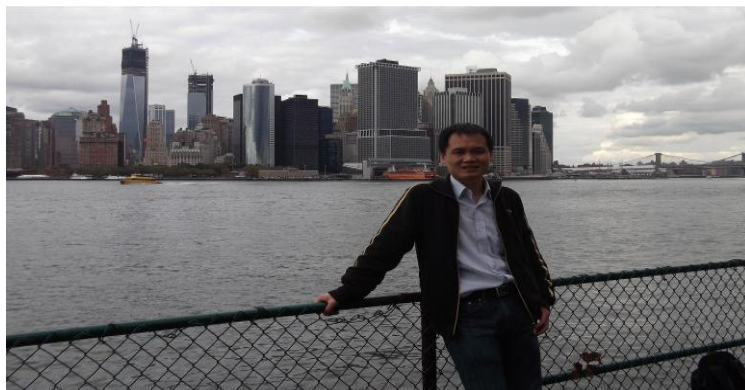
（总督岛上吹风，后面有双子大楼和布鲁克林大桥）