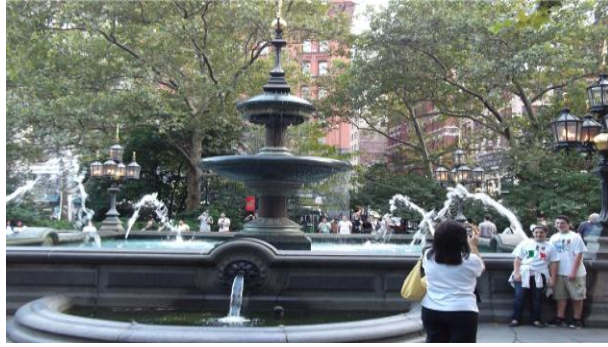
(市政大厅前的广场)

在该广场上，我拿出地图看一下，就有一个人上来问我，是否需要帮忙，于是就让她帮我指导怎么到世贸中心。她热情地指点了。在纽约，乐于助人的人还是不少。到了世贸中心后，看着这两座大楼，想起 911 的场景，不禁感慨万千。在这些高楼下，人是非常渺小的。