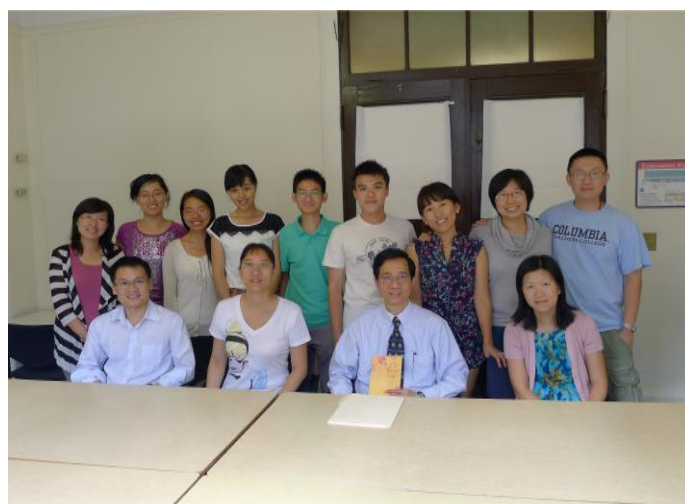
（上曾老师课程的部分学生和曾老师合影）

一直上到 2 点半，下课后，我们把一起签名的一个贺卡作为教师节礼物送给曾老师，还一起合影留念。