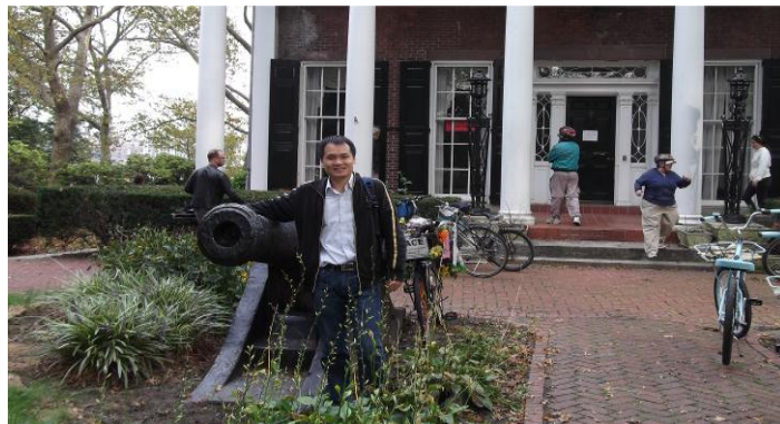
（后面是总督开会的会议室）

第三，岛上有租好几个自行车的地方，价格好像也不都一样，一般是 15 刀 2 个小时。我们都没要，直接走路。其实走路也很快，一个多小时就转完了。