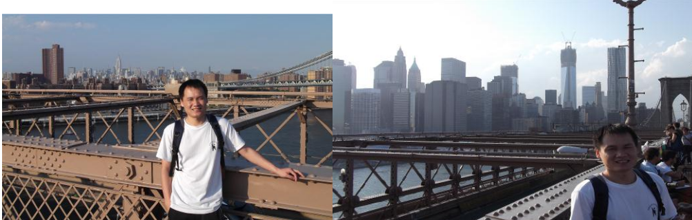
布鲁克林大桥的两边

大概走了一个小时，把桥走完，就走到曼哈顿区了。向西走几步就看到纽约市市政大厅（City Hall），大厅不大也不高，看上去比较典雅，也比较干净，飘着几面美国国旗。