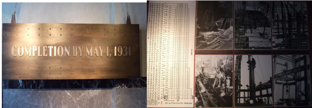
帝国大厦 80 楼的一些图片

在 80 楼，有一个木板，上面写着帝国大厦完成于 1931 年 5 月 1 日，还有一些工人在当时施工的照片等，以及电影“金刚”的宣传照，因为“金刚”有一个很震撼的场景就是在帝国大厦上拍的。美国能在 20 世纪 30 年代就有这样的建筑技术，确实是非常伟大。