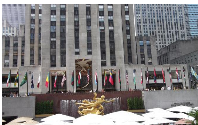
纽约洛克菲勒广场

洛克菲勒中心包括 30 多座建筑，其中主建筑最高，而且主建筑有一个 top of rock，可以上去观光，观看纽约市的全景，票价要 20 刀左右。由于我曾去过帝国大厦，看过纽约市的全景，我觉得风景应该差不多，所以就没上去，就在边上转转。