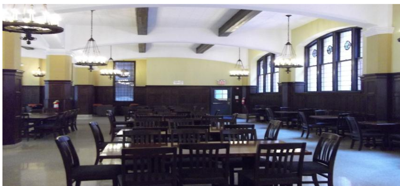
(哥大 TC 餐厅)

明天我要把电脑带上，然后有时间就去办理 SSN，另外，明天去听下导师的课程，还要考虑去选几门课来旁听，也要去找老外多交流交流，现在学习的欲望和兴趣还是不小的。