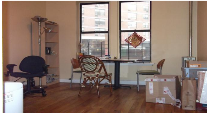
(我所住地方的客厅)