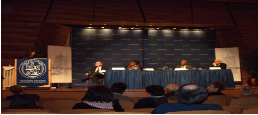
（“教育政策和社会分析系成立大会”上的研讨）