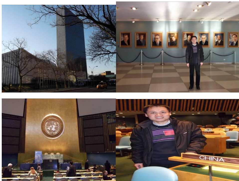
（联合国的一些照片）

随后，由 3 个嘉宾分别发言，每人发言 10 分钟，他们发言的内容基本上都是和联合国相关的，也都提到了世界上一些新兴国家对美国的挑战，“中国”的出现频率也挺高的。然后进入提问环节，仍旧有很多人提问。他们的发言我只能尽力听懂百分之五六十，而那个新加坡人能听懂百分之百，他们从小就有英语的氛围，中国人的英语听力和口语不好和氛围、教学方法、中文语系等都有关系吧。