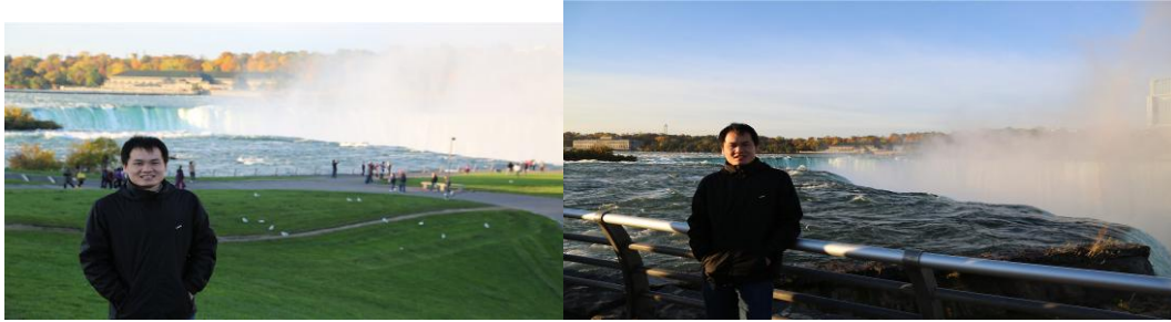
(白天的马蹄形瀑布)

昨晚睡的比较晚，不过睡的还可以。今天6点半被酒店的催醒电话叫醒，起来收拾后，吃了点饼干和番茄作为早饭，7点半上车出发。导游先带我们到了昨晚看过的马蹄形瀑布那里欣赏。白天看起来更壮观好看，落差很大，气势很宏伟，而且形成了彩虹。很多人在那里照相。