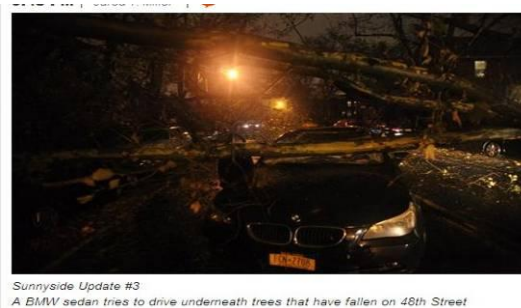
(48 街，倒塌的树压住宝马车)

今天是 Sandy 飓风的第二天，本来以为还会有余威。不过今天早上起来看，已经风平浪静了。对我们 uptown 来说，几乎没有什么影响。不过据说 downtown 那边影响挺大，有停电、树倒塌、地铁进水等。