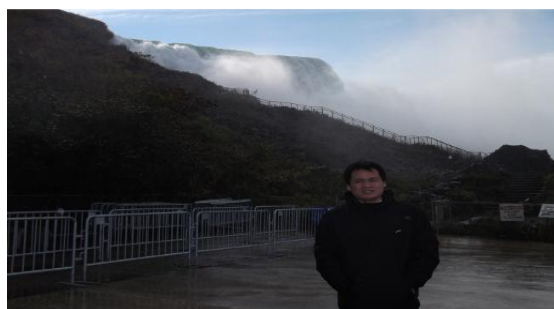
（后面就是那条走不通的路）

下船后，然后我们本来想从另外一端上去，因为这一端可以更近地看瀑布。结果发现走不通，于是又只好回来原路返回。而这端的话，离大瀑布很近，但是也很容易被打湿。我们的裤脚都有点打湿。