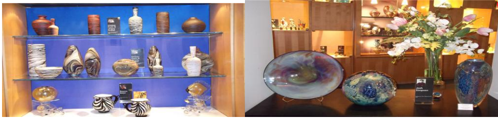
(康宁玻璃中心的一些展品)

欣赏到 3 点半，大巴准时发车开往纽约。在路上，导游又找我们要了 12 刀的服务费。路途实在是太远了，到 8 点半才到纽约唐人街。大巴司机也很辛苦，这两天开了这么长时间的车，而且还是个美国女司机。我在路上就是睡觉、看外面风景、和郭老师聊天、看电影。