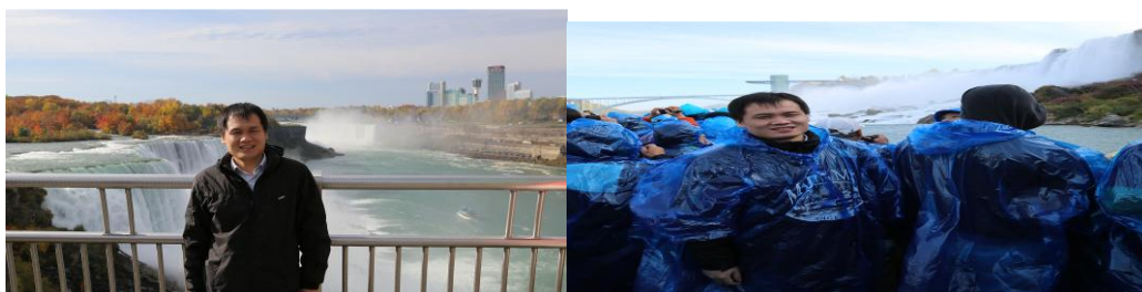
（上船之前和船上看到的尼亚加拉大瀑布）

非常漂亮，不能不叹服大自然的伟大。但是靠近大瀑布的时候，瀑布溅出来的水花也非常大，就好像是下小雨一样。幸好有雨衣的保护，淋的不是很湿。大瀑布真的是很宏伟壮观，很多人都说不虚此行。